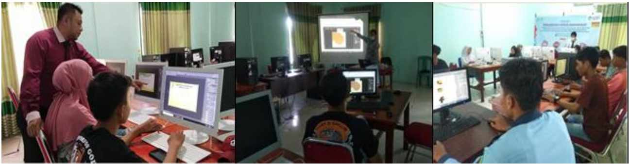
Gambar 3. Tim Pengajar memberikan materi tentang desain grafis dengan Adobe Photoshop

Dokumentasi pada gambar 4 terlihat bahwa peserta wajib mengisi daftar hadir pelatihan. Gambar dibawah ini hanya mewakili saja dari daftar hadir keseluruhan. Absensi tiap pertemuan dibagi menjadi 2 termin. Termin 1 dilaksanakan pada pukul 10.00–12.00 WIB dan termin 2 dilaksanakan pada pukul 13.00–15.00 WIB.