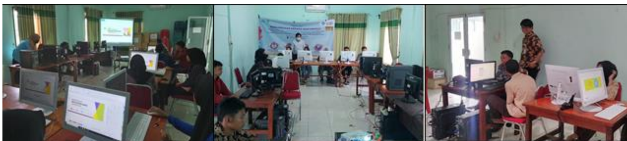
Gambar 2. Tim Pengajar memberikan materi tentang desain grafis dengan CorelDraw

Dokumentasi pada gambar 2 terlihat kegiatan pelatihan desain grafis menggunakan CorelDraw disampaikan oleh tim pengajar bagaimana membuat logo, spanduk, banner, sertifikat dan poster dan para peserta diajarkan bagaimana menghasilkan ide dan kreatifitas yang dimiliki peserta dalam merancang gambarnya.