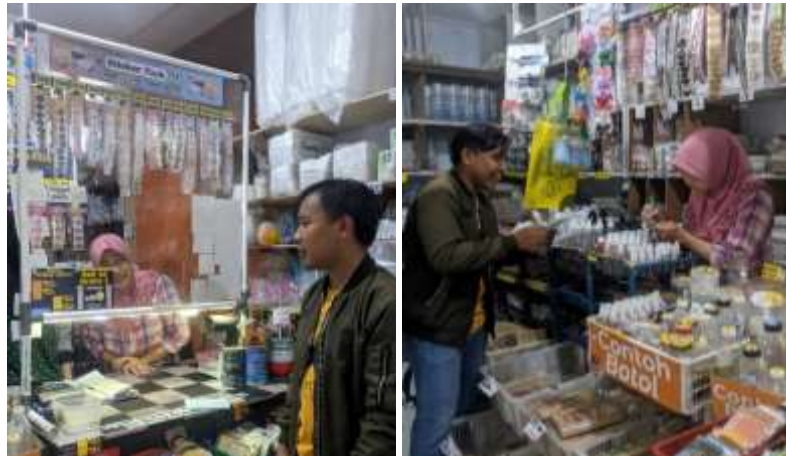
Gambar 2. Sosialisasi dan tanya jawab dengan pelaku usaha

dapat memantau persediaan barang mereka secara teratur, mengetahui jumlah barang yang tersedia, serta dapat merencanakan pengadaan barang dengan lebih efektif.