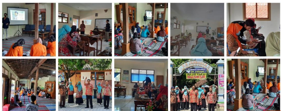
Gambar 3.5 Kegiatan Penyuluhan dan Pelatihan Media SAFEKids

Dalam pelaksanaan tersebut didapat hasil bahwa yang awalnya 40/45 responden tidak mengetahui bahwa apa yang mereka perbuat merupakan indikasi perbuatan kekerasan anak, kemudian didapatkan hasil 45/45 mengetahui secara baik dan berhasil mengimplementasikan dengan baik. Maka dari itu dalam memberikan pendidikan dan pemberdayaan sangat berdampak dan dibutuhkan kepada masyarakat dalam mengembangkan kapasitas untuk menangani ancaman dan menangani permasalahan konstituen yang ada dalam kekerasan anak (Supiyanto & Novemyanto, 2023). Jika hal tersebut dibiarkan saja maka akan menjadi kelalaian masyarakat mitra dalam menghormati hak anak sebagai hak asasi manusia. Sebagai contoh, jika masyarakat tetap melakukan kekerasan mereka akan dinobatkan sebagai pelaku tindak pidana. Yang dimana hal tersebut telah ditegaskan Pada Pasal 76 C UU No 35 Tahun 2014 tentang perlindungan anak yang menyatakan bahwa “ Setiap Orang dilarang menempatkan, membiarkan, melakukan, menyuruh melakukan,