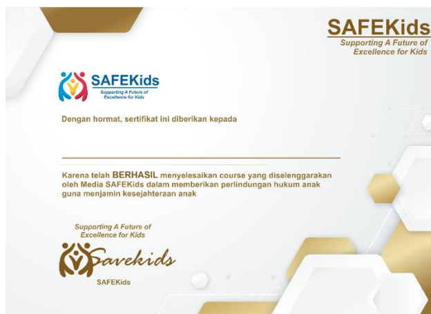
Gambar 3.4 Sertifikat Penghargaan Penyelesai Course