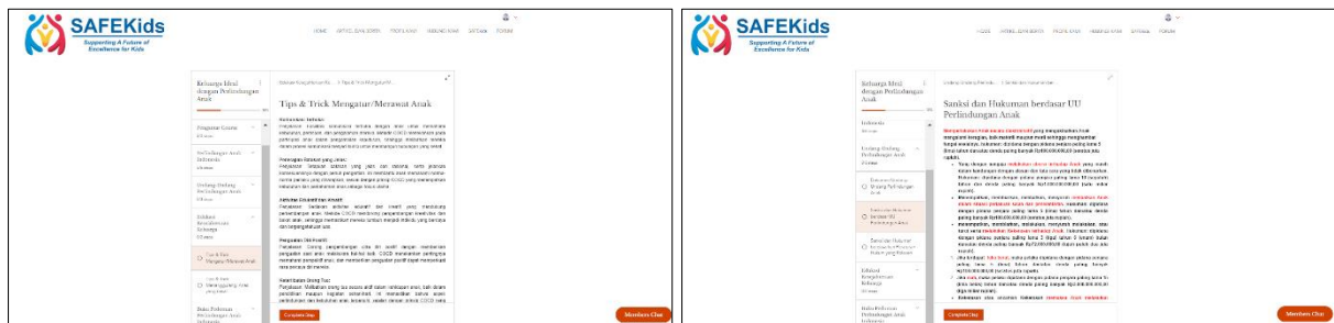
Gambar 3.3 Menu Course